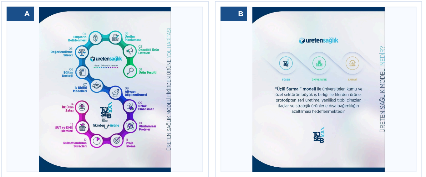
Şekil 1. TÜSEB Sağlık Modelleri A) Üreten Sağlık Modeli; B) Üçlü Sarmal Modeli

TÜSEB 'in tanıtımında üreten sağlık üçlü sarmal modeli kapsamında; akademi, kamu ve uygulama sahası arasında veri odaklı iş birliği kurulmasının çocukluk çağı obezitesinin önlenmesi ve yönetiminde belirleyici olduğu vurgulanmıştır (Şekil 1).