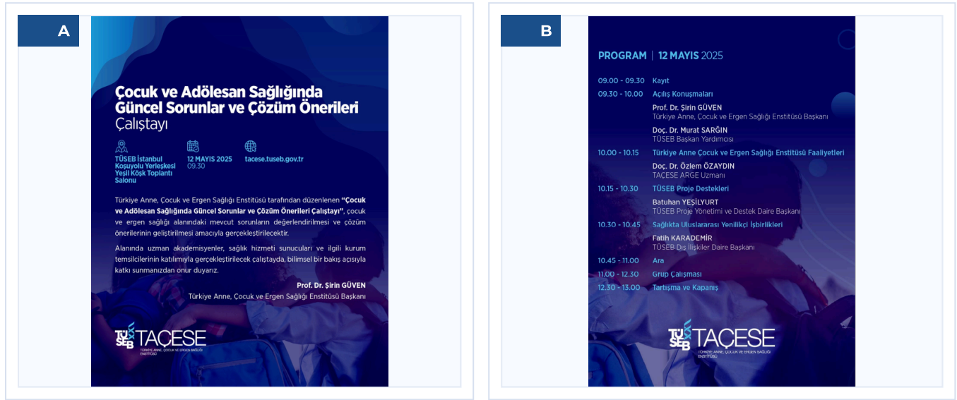
Şekil 1. Çocuk ve Adolesan Sağlığında Güncel Sorunlar ve Çözüm Önerileri Çalıştay A) Davetiye; B) Program

Türkiye Sağlık Enstitüleri Başkanlığı (TÜSEB) Türkiye Anne, Çocuk ve Ergen Sağlığı Enstitüsü (TAÇESE) bünyesinde 12 Mayıs 2025 Pazartesi günü yapılan çalıştay programı ve katılımcıların davetinin amacı; çocukluk ve ergenlik dönemlerinde bireylerin fiziksel, zihinsel ve sosyal gelişimlerini destekleyerek, sağlıklı bir toplumun temellerini atmak amacıyla bu yaş gruplarına yönelik etkili projeler, sağlık politikaları geliştirilmesi ve uygulanmasıdır (Şekil 1).